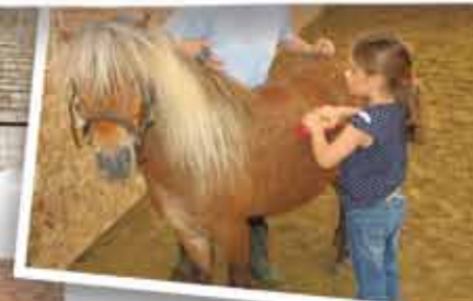
LA CONCENTRATION ET LA RELATION