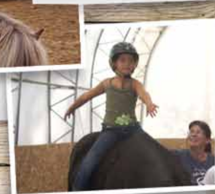
LE MOUVEMENT, LA CHALEUR ET L'ÉQUILIBRE