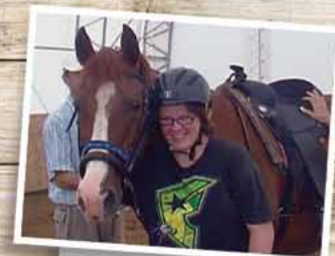
LE PLAISIR, LA SÉCURITÉ